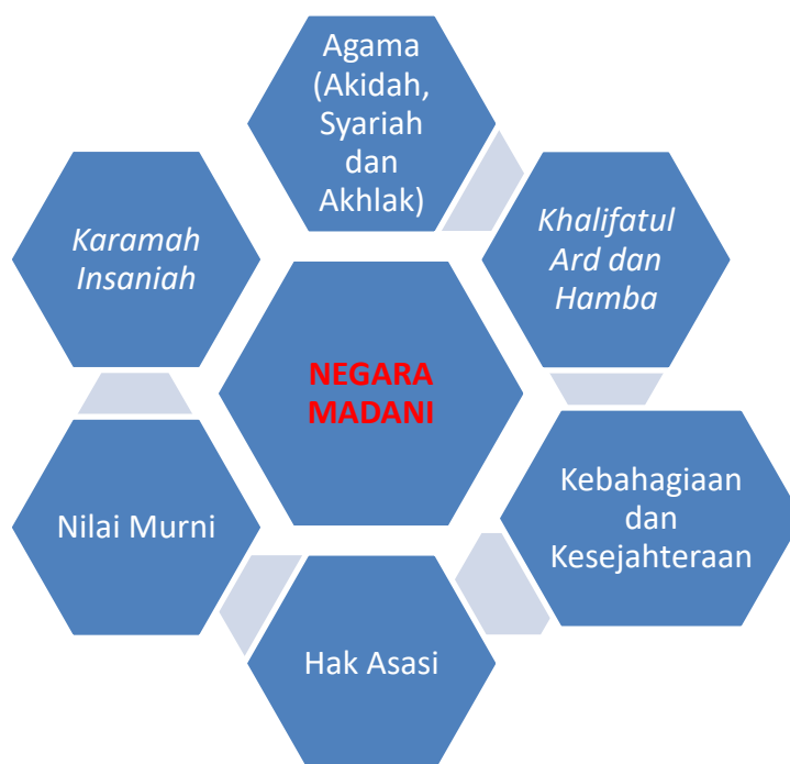
Gambar rajah 1. Konsep Negara Madani.

Berdasarkan kepada sebahagian daripada perbincangan para sarjana berkaitan konsep negara Madani, secara ringkasnya dapat dirumuskan dalam rajah seperti berikut: