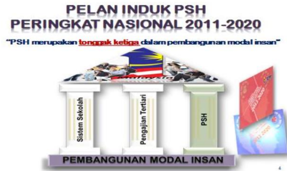
Rajah 3. Pelan Induk Pembudayaan PSH Peringkat Nasional 2011-2020.