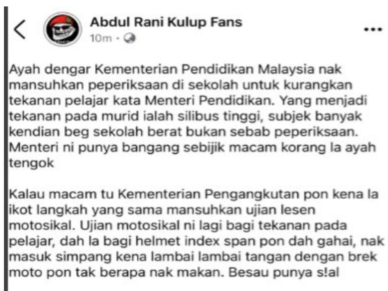
Rajah 1. Kritikan Terhadap Pemansuhan Peperiksaan.

Berdasarkan analisis yang dijalankan, didapati bahawa humor dapat disampaikan menerusi bentuk-bentuk humor seperti sindiran, tempelak, kelakar, candik, melawak, perli dan kata jenaka atau berseloroh.